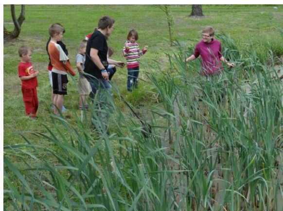
W poszukiwaniu żab i kumaków