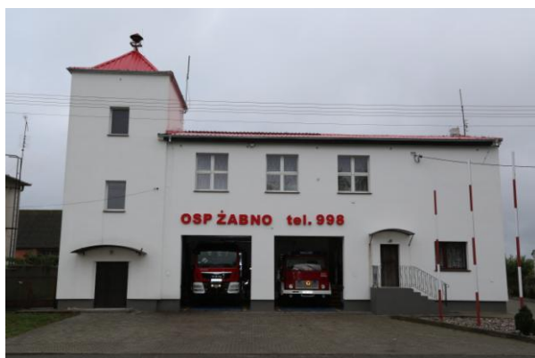
Strażnica OSP Żabno