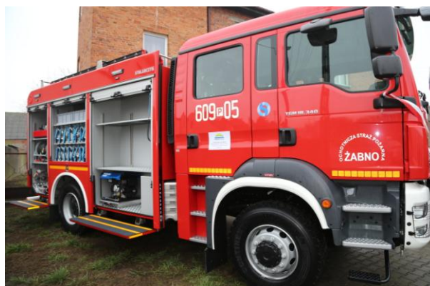
Nowy samochód strażacki